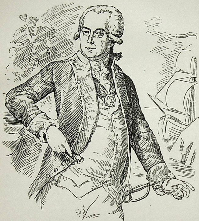
Григорий Иванович Шелихов (1747—1795)